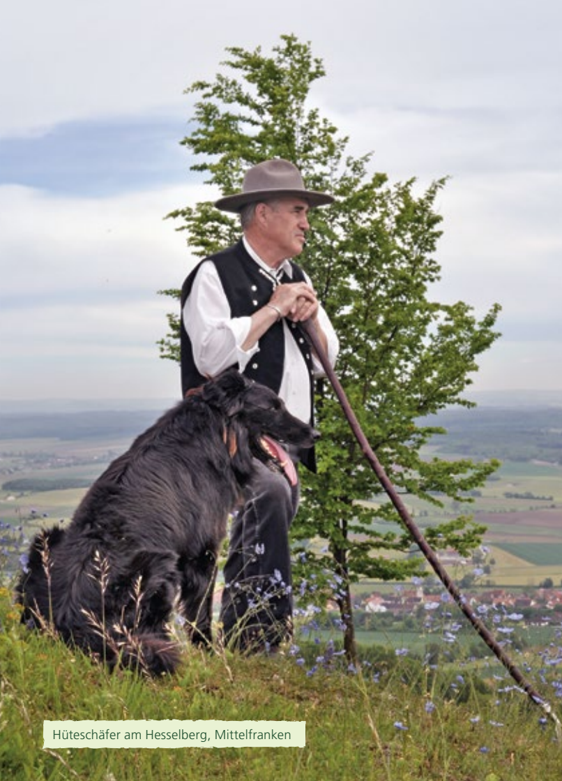
Hüteschäfer am Hesselberg, Mittelfranken

„ Bei der naturnahen Landschaftspflege in den Kommunen sind Schafe wichtige Helfer. Wir Gemeinden setzen wieder mehr auf Beweidung. Wir informieren Schäfer über Wege und Weideflächen und wirken auf diese Weise auch an der Wertschöpfung mit. “