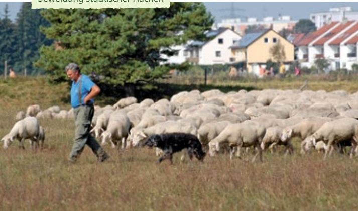
Beweidung städtischer Flächen