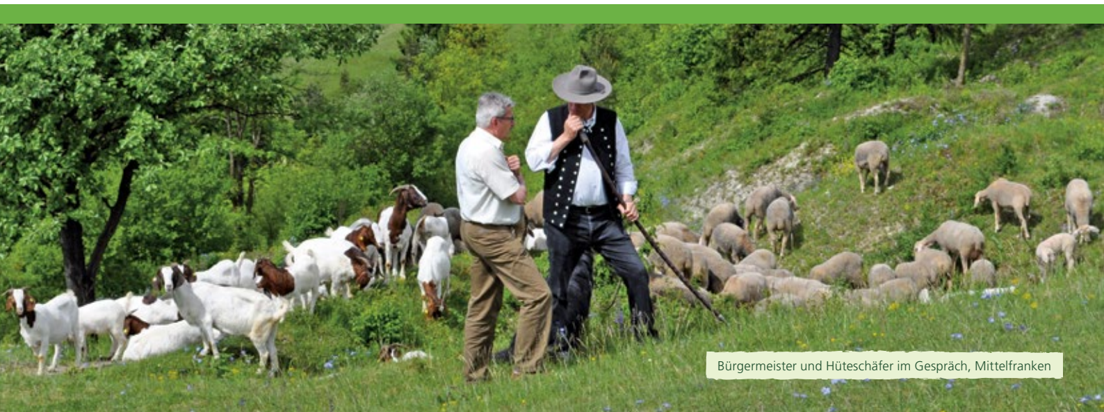
Bürgermeister und Hüteschäfer im Gespräch, Mittelfranken